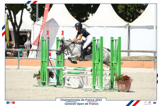
Championnats de France 2022 Generall Open de France