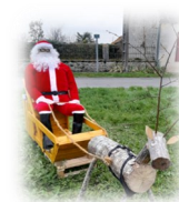
Traineau du Père-Noël